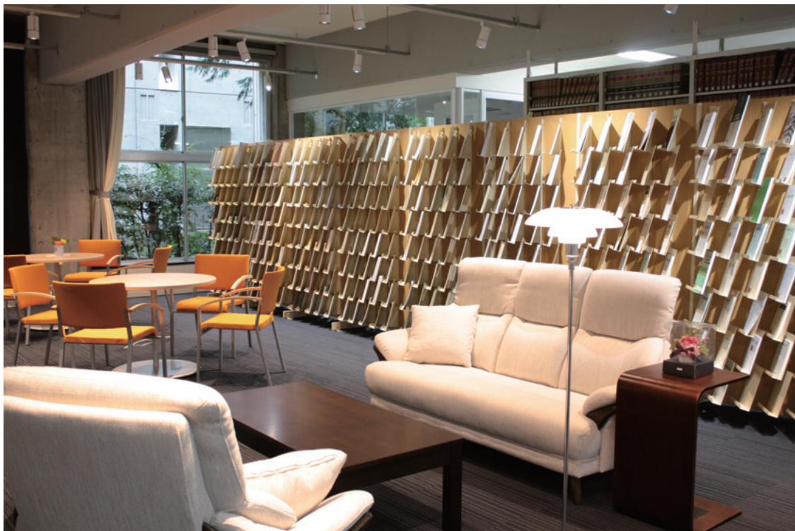
ブラウジングスペース

資料や人から情報を収集し、相反するものの調和とバランスを 求めて、時代に先駆けて変わり続ける資料室